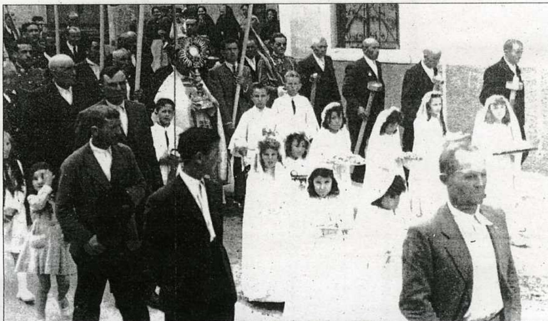
Una de las fotografías más antiguas que conserva la Cofradía del Santísimo Sacramento y Jesús de la Minerva data de 1943