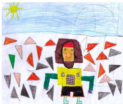
Jamal Ennabbagui (7 años)