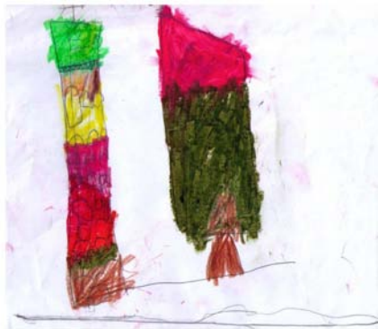
Sara Blanco (4 años)